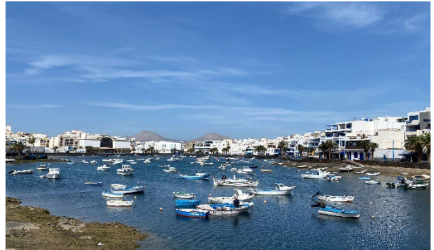
ARRECIFE ist Hauptstadt von Lanzarote